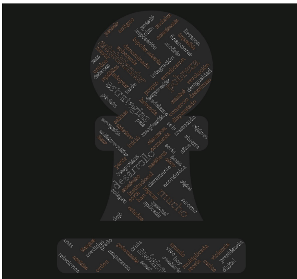
Figura 2. Nube de palabras Política Social PND 2019-2024

Fuente: Elaboración propia, con base al PND 2019-2025, Política social, construir un país con bienestar. pp. 34-37.