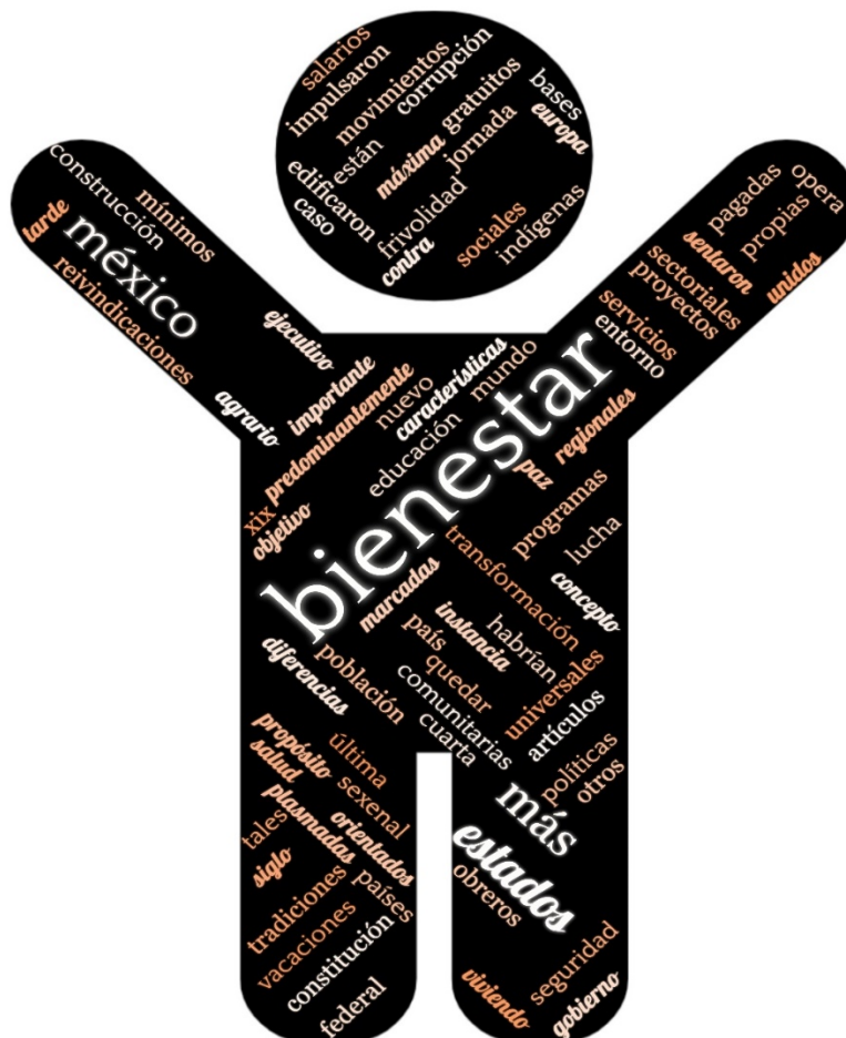
Figura 3. Nube de palabras Política Social PND 2019-2024

Fuente: Elaboración propia, con base al PND 2019-2025, Política social, construir un país con bienestar. pp. 34-37.