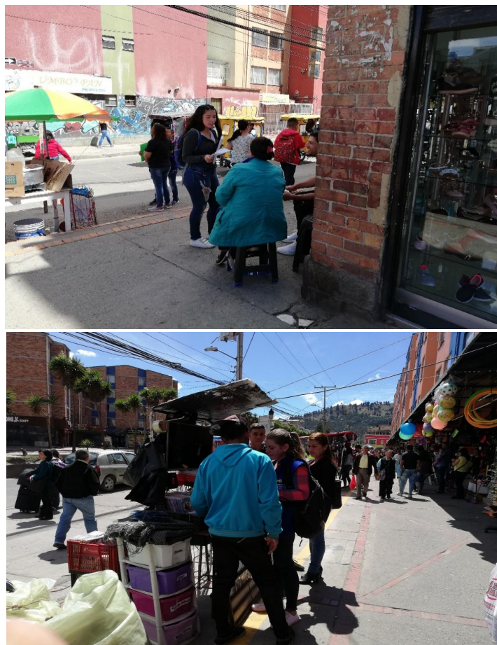
Figuras 1, 2 y 3. Ejemplos de una carreta, ventas en suelo y mesa en el espacio público

Los profesionales en seguridad y salud en el trabajo se organizaron con una cuidadosa logística, y cubrieron toda la zona de ventas ambulantes. En grupos de dos personas abordaban a los vendedores en momentos que no estuvieran ocupados; para ello se escogieron días y horarios en los que la actividad de ventas era baja. Las imágenes 8 y 9 muestran a los profesionales interactuando con la población objeto de estudio.