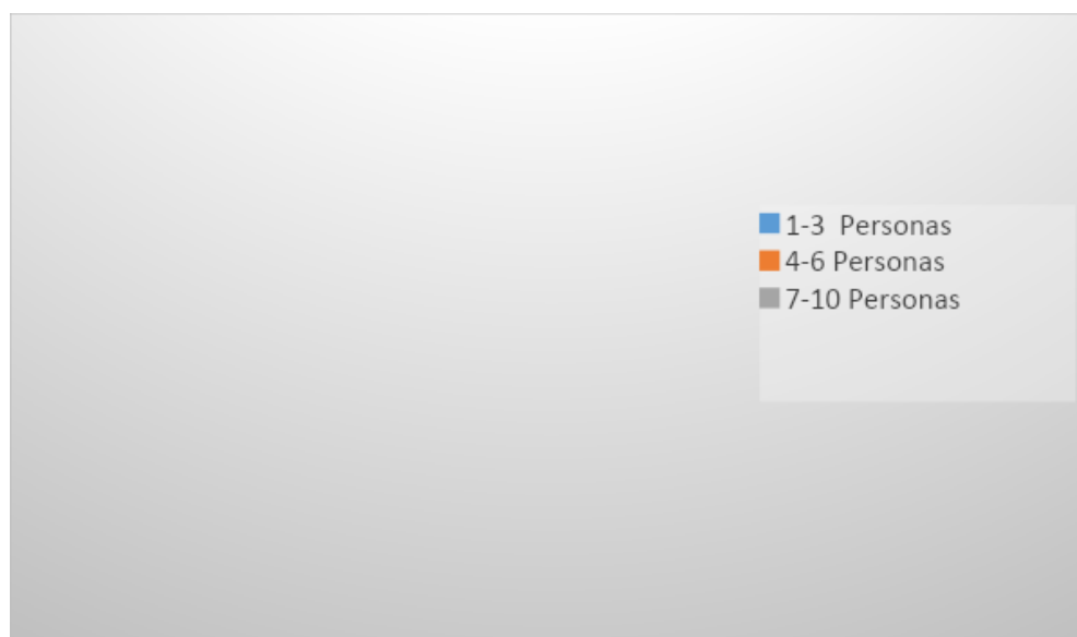
Figura 2. Porcentaje de personas que dependen económicamente del vendedor ambulante y/o estacionario

Otro hallazgo relevante del estudio muestra que más del 42% de la población no cuenta con afiliación al régimen contributivo, mientras que el restante sí pertenece al