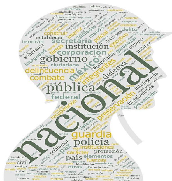
Figura 3. Seguridad, política y gobierno PND 2019-2024.

Fuente: Elaboración propia, con Base PND 2019-2024, pp 26-32.