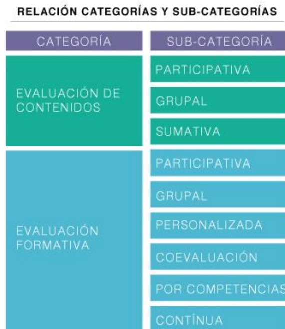
Figura 2. Relación categorías y Subcategorías.

Después de la lectura de los referentes académicos se realizó una triangulación entre las categorías reconocidas en primer análisis, las nombradas por otros autores e investigadores y los comentarios de las investigadoras en las sesiones grupales. Gracias a este ejercicio se reconoció cómo las 10 categorías presentadas en el primer ejercicio (Gráfica 1) podían ser agrupadas en dos categorías mayores: la evaluación de contenidos y la evaluación formativa. Las demás categorías eran características de alguna de las dos categorías mayores.