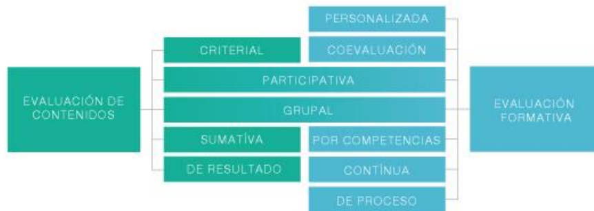
Figura 3. Características de los tipos de evaluación.

Durante los primeros meses de la emergencia sanitaria provocada por el COVID-19 los docentes llevaron a cabo procesos de evaluación de contenidos, caracterizados por aplicarse al finalizar el semestre, preocuparse por establecer criterios claros y propender por espacios donde los estudiantes participaran de forma grupal.